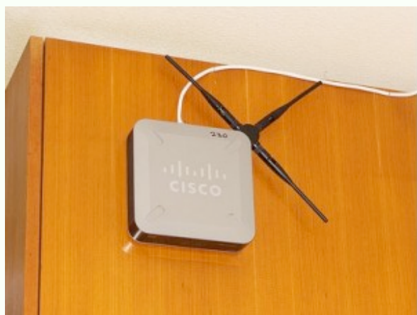
Routeur de type industriel installé dans une école.

L'ingénieur Paul McGavin souligne que, dans les aires ouvertes, comme les classes, que l'on soit à 1 m ou 50 m du modem ou du routeur, l'exposition sera élevée car les ondes se propageront à leur pleine puissance comme la lumière. Un autre ingénieur californien, le baubiologiste Lawrence J. Gust, explique que lorsque 20 ou 30 ordinateurs rapprochés sont connectés en mode Wi-Fi, ces appareils exposent les usagers à des densités de puissance de RF plus élevées que celle produite par le routeur.